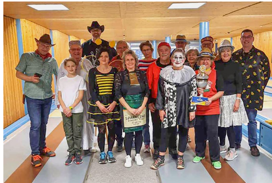
Teilnehmer und Gewinner des diesjährigen Faschingscups: Nordic Walking