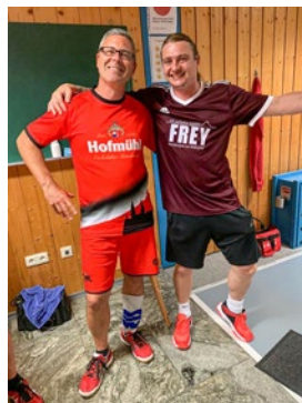
„Spiel & Spass“ dachten sich „Sigg & Gigg“