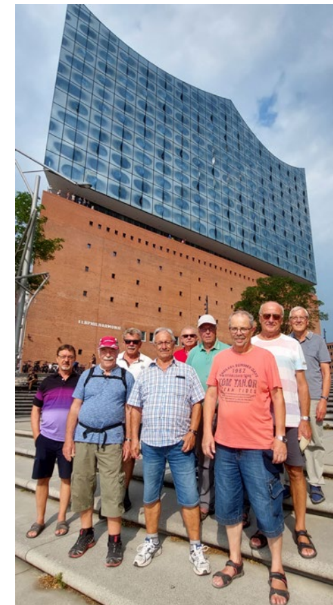
Das obligatorische Gruppenfoto entstand nach dem Besuch der Elbphilharmonie, die ja als das neue Wahrzeichen Hamburgs gilt.