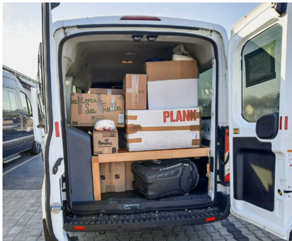
Voller Respekt, das Volleyballteam

Tief bewegt, voller nachdenklich stimmender Impressionen und im Bewusstsein, das Wochenende nicht sinnvoller verbracht haben zu können, kehrte unser freiwilliger Helfer nach erfolgreich abgeschlossener Mission nach Eichstätt zurück ... .., – bereit, eine solche Aktion jederzeit zu wiederholen!