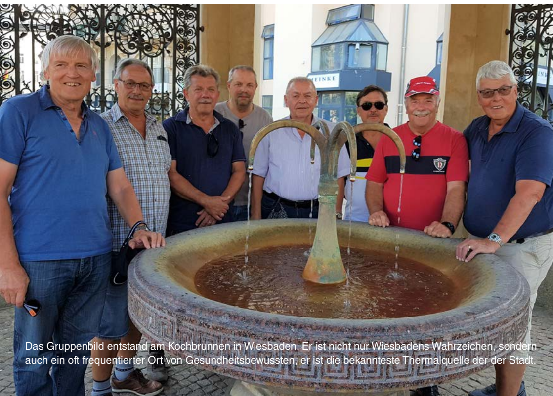
Das Gruppenbild entstand am Kochbrunnen in Wiesbaden. Er ist nicht nur Wiesbadens Wahrzeichen, sondern auch ein oft frequentierter Ort von Gesundheitsbewussten; er ist die bekannteste Thermalquelle der Stadt.